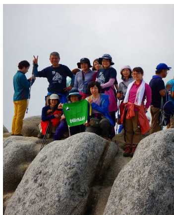
2016年度登山教室修了山行燕岳山頂にて

【ホームページ】「泉州労山」で検索してみてください、当会の活動等の内容が詳しくわかります。